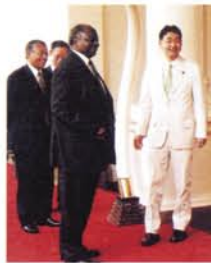
ケニア共和国キバキ大統領との会談を終えて。大統領からは日本の国際連合安全保障理事会常任理事国入りへの明確な支持表明がなされました