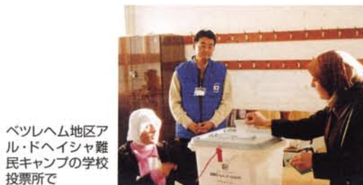
ベツレヘム地区アル・ドヘイシャ難民キャンプの学校投票所で