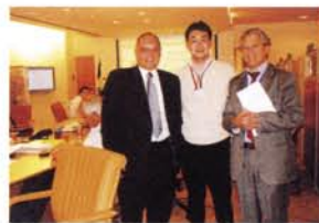
イスラエル外務省ナダイ次官補らと同省オペレーションルームにて。選挙へのイスラエル政府の協力を強く要請

結果はマハムード・アッバス(現地ではアブ・マーゼンが通り名)氏が大勝。指導者を直接選ぶというアラブで事実上初めての歴史的瞬間に立ち会うことができました。これから中東和平の実現に力を尽くします