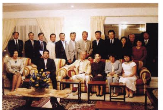
駐オマーン日本大使公邸で商社やJICAなど滞在邦人の皆さんと懇談