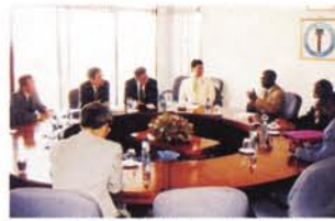
日本の経済協力案件のKEMRI(ケニア中央医学研究所)を視察