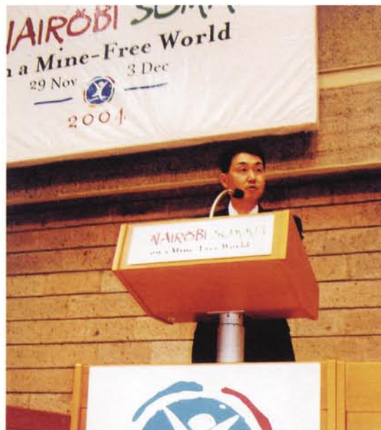
「対人地雷禁止条約第一回締約国検討会議」で演説。日本政府の「地雷対策支援方策(カワイ三原則)」を発表しました