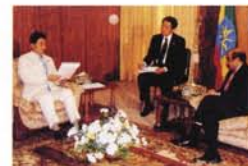
メレス・エチオピア首相との会談。国営放送のニュースで大きく報道され、首相から日本の常任理事国入りへ支持が表明されました