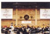
条約締約国144カ国中110カ国の政府代表と26の国際機関、それに地雷廃絶活動を行っているNGO13団体が参加