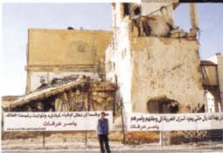
廟のすぐ横にある議長府舎の一部には砲撃の跡が今なお生々しく