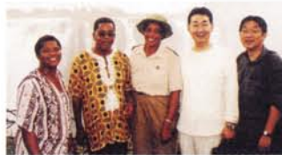
ザンビア・ジンバブエ国境にあるヴィクトリア滝観光資源の視察