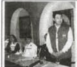
監視団結団式で挨拶する監視団長(左)と副団長(右)ら。背景には、パレスチナ自治政府の旗が掲げられている。

結団式にて24名の日本政府監視団に団長訓示 「日本経済新聞」'05年1月8日夕刊