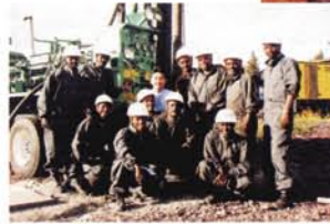
アディスアベバにある日本の経済協力で完成した「地下水開発・水供給訓練計画」の研修生たちと。日本のIDO(井戸)掘り技術によって、アフリカの大地で清らかな水資源が確保できる日を夢見しています