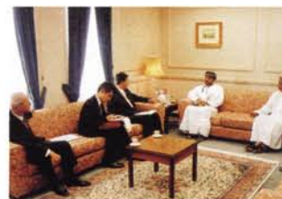
オマーンのバドール外務次官らと会談。日本の国際連合常任理事国入りに明確な支持表明がなされました