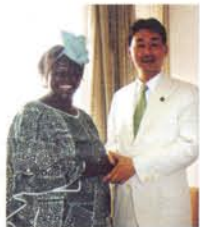
アフリカ人女性初のノーベル平和賞受賞者マータイ環境副大臣と。女史の早期訪日を要請しました