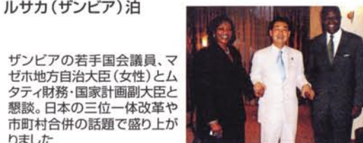
ザンビアの若手国会議員、マゼホ地方自治大臣(女性)とムタティ財務・国家計画副大臣と懇談。日本の三位一体改革や市町村合併の話で盛り上がりました