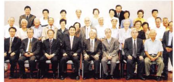
広島弁で「みなさん、達者で頑張ってください」と激励しました。新築されたサンパウロ広島県人会館にて