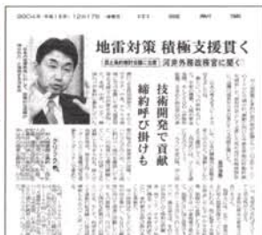
「中国新聞」'04年12月17日朝刊