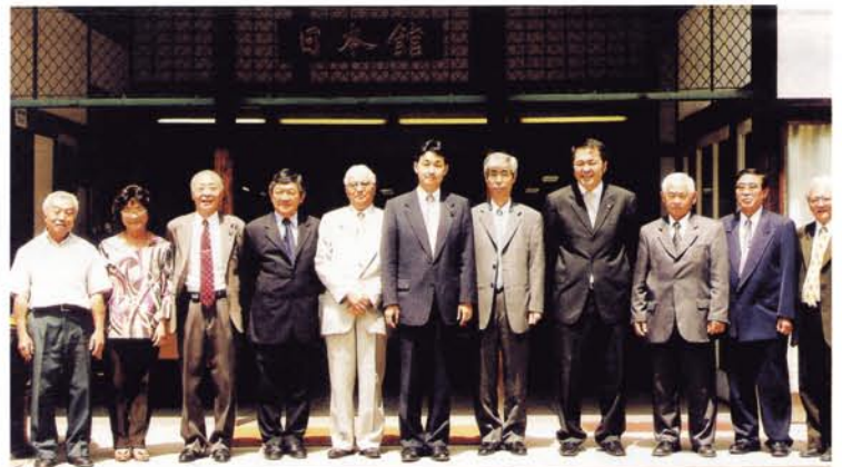
サンパウロ (ブラジル) の開拓先没者慰霊碑に献花した後、日本人館前で日系人会幹部と

広島県出身日系移民の皆さんの往時のご苦労を思うと自然と涙があふれてきました 「ニッケイ新聞」 '04年11月12日