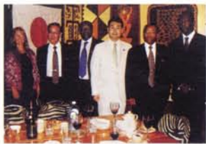
ケニア共和国の外相、貿易産業相、情報相兼観光相代行主催の夕食会。昨年11月に広島のお好み焼き店で彼らを歓待した答礼です