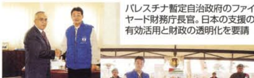
パレスチナ暫定自治政府のファイヤード財務庁長官。日本の支援の有効活用と財政の透明化を要請