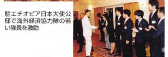
駐エチオピア日本大使公邸で海外経済協力隊の若い隊員を激励