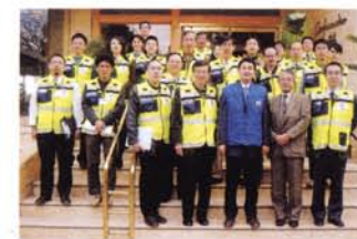
無事に監視活動を終えた日本政府監視団の皆さんと。他国の監視団以上に情熱を持って真剣に活動に当たってくれました

記者会見後、(左)バドール外務次官と会談し、(右)ザウイイ国王特別顧問と会談した。監視団は、アンマン(ヨルダン)へ移動し、アレンビー橋を通過した。ヨルダン外務省は、監視団の来訪を歓迎し、選挙の実施に協力した。ヨルダン王子ミラードと国際協力相アワダッラーとも昼食懇談会を行った。