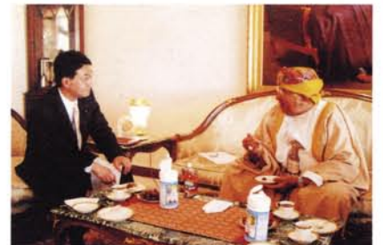
日本の政財界に太い関係を持つ国王特別顧問のザウイイ閣下とは、広島風お好み焼きソースに使われているオマーン産デザート(乾燥したなつめやし実)の話題で盛り上がりました