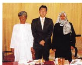
アラブ世界では珍しい女性国会議員(国家評議会議員)のファウジーヤ女史と現地日刊紙のザッジャーリ編集長と会食。お二人とも友好協会のある安東公民館をご訪問されたことがあります