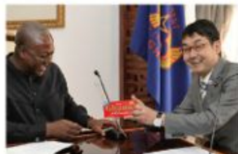
マハマ大統領に「ガーナ」チョコレートを手渡す