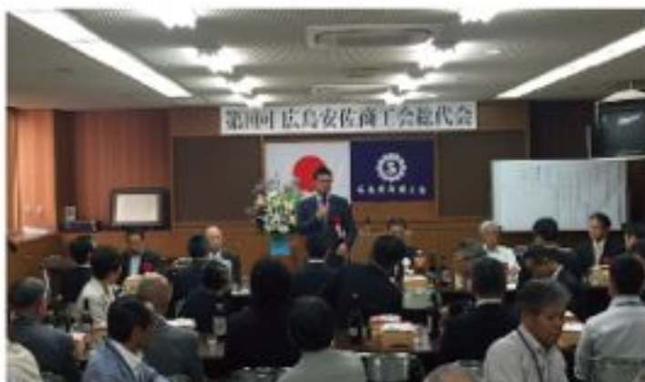
広島安佐商工会総代会（5月28日）