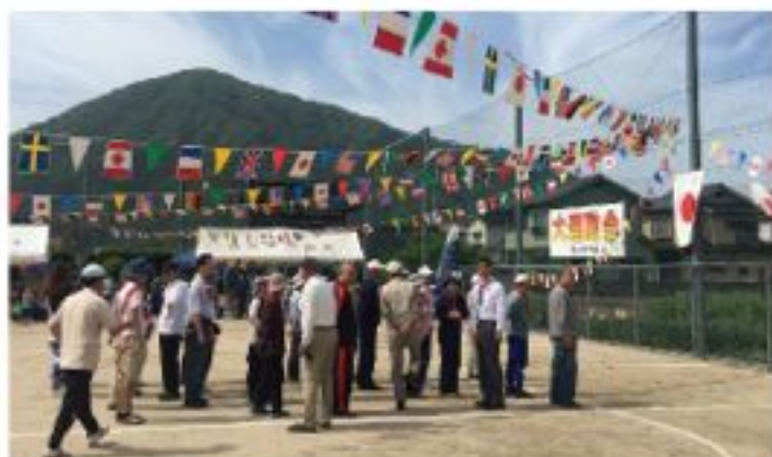
四日市町民運動会でスプーン運び競争に参加（5月8日）