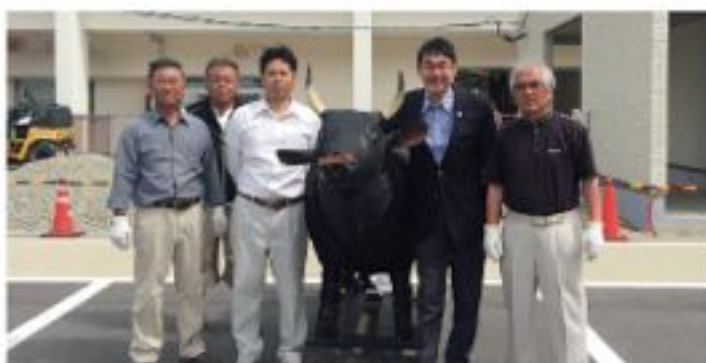
販買花田権え (5月15日)