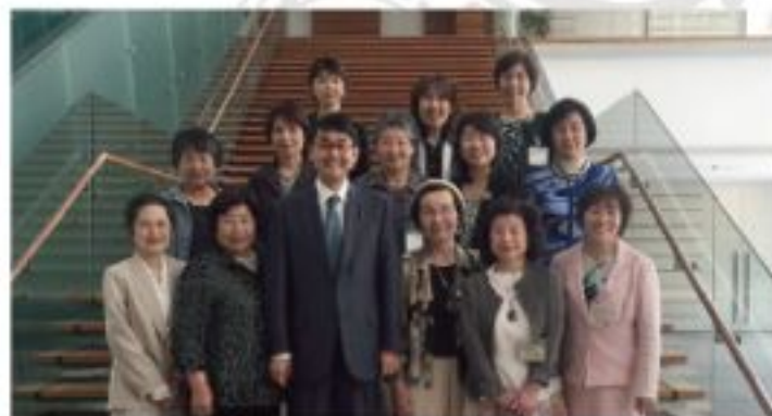
安芸高田市やよい会総理大臣官邸・国会見学ツアー（5月20日）