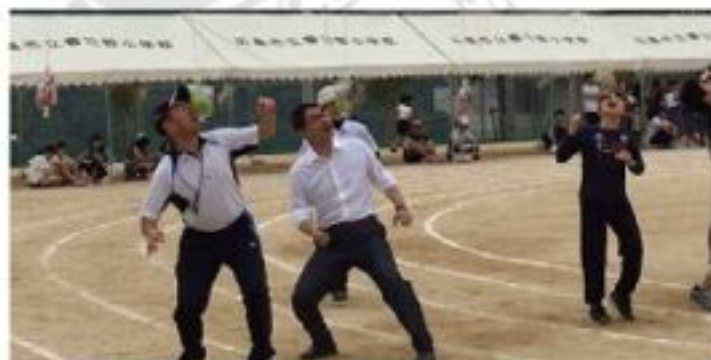
春日野学区町民運動会の障害物競走でこの直後にバツタンと転倒。両手両足額に擦り傷切り傷打撲を食い、ズボンがビリビリに裂けながらもゴ〜ル（5月15日）