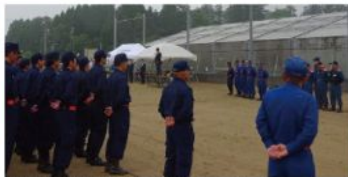
広島県消防協会山県支部合同訓練 (5月29日)