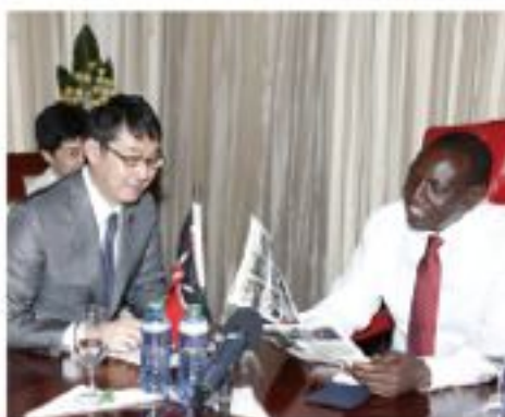
ルト副大統領との会談は四回目です