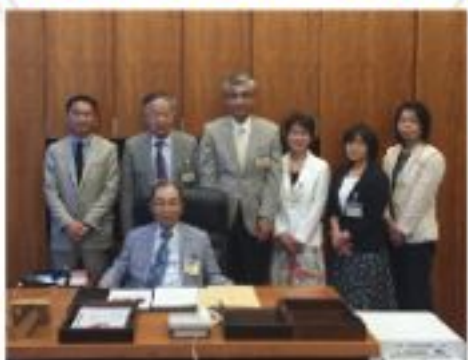
芸北建設業協会の皆さまが総理補佐官室に 来訪 (5月12日)