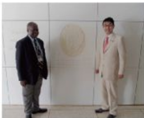
野口研究所玄関に飾られる野口英世博士の顕彰板

5月8日（日）～13日（金）、河井克行内閣総理大臣補佐官はアフリカ大陸東西の有力国であるガーナとケニアを訪れました。ガーナでは、マハマ大統領に安倍総理大臣の親書を手渡しました。また、野口英世博士ゆかりの野口記念医学研究所を訪れ、G7伊勢志摩サミットおよび八月ナイロビでのTICAD VIで議論されるエボラ熱感染症対策など途上国における健康増進対策の拠点を熱心に視察。さらにケニアでは、総理大臣官邸に設置された「アフリカ経済戦略会議」議長代行として、日本政府が重視するモンバサ港地域の経済協力案件についてルト副大統領らと率直な意見交換を行いました。