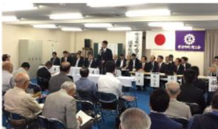
安古市町商工会総代会（5月29日）