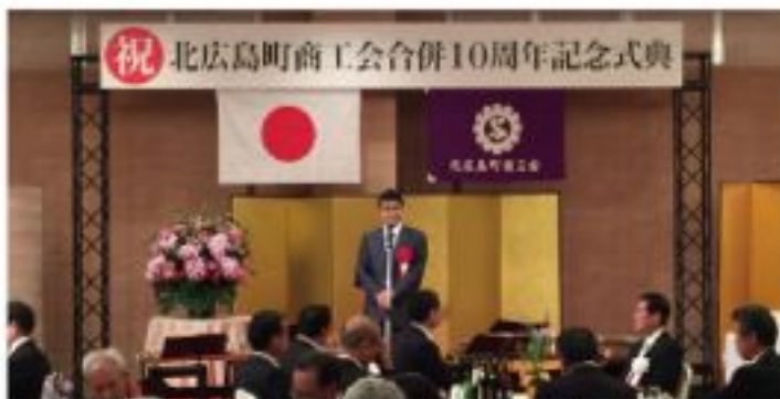
北広島町商工会合併10周年記念式典 (5月20日)