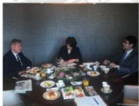
ジョン・チップマン 英国国際戦略研究所 (I I S S) 所長と朝食会 (4月18日)