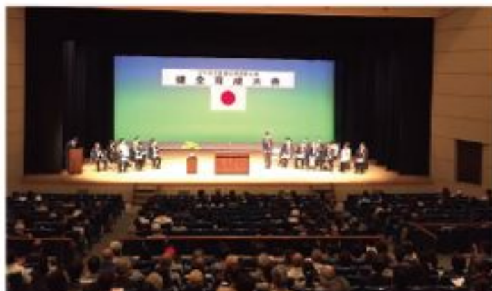
少年を育む安佐南区民の会健全育成大会（5月28日）