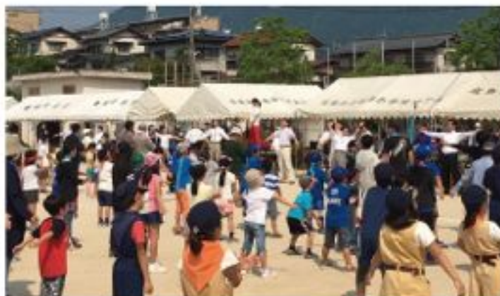
亀崎学区町民運動会で準備体操（5月22日）