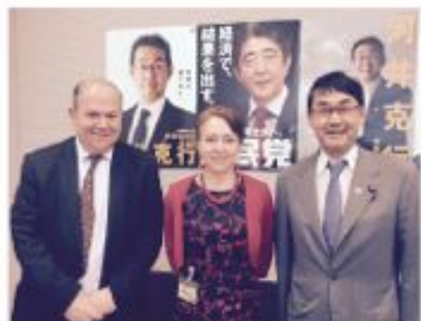
英国の王立安全保障研究所 (RUS I) ヒッ ベル所長とアイル国際部長が総理補佐官室に 来訪 (5月18日)