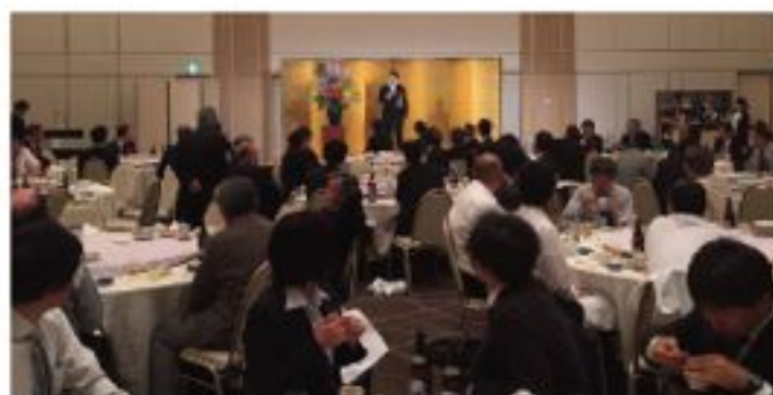
広島県土地家屋調査士会総会 (5月27日)