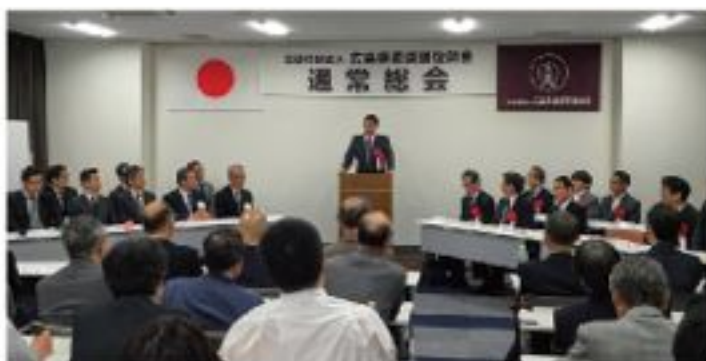
広島県柔道整復師会総会 (5月29日)