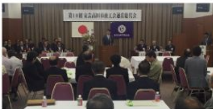
安芸高田市商工会総代会 (5月26日)