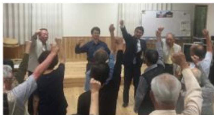
安地域安北支部国政報告会（5月23日）