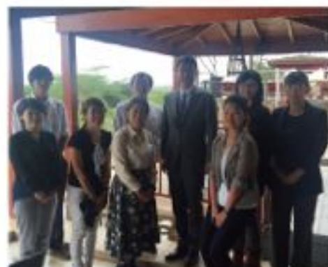
ケニアで活躍する青年海外協力隊およびシニア・ボランティアの皆さまと