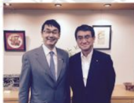
河野太郎・防災担当大臣に「8.20. 豪雨 災害」体験継承事業について陳情 (5月18日)