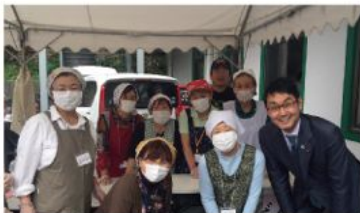
社会福祉法人可部大文字会15周年記念行事で大林女性会の皆さまと（5月19日）