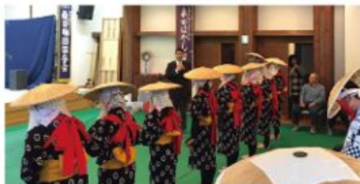
桑田花田権え (5月29日)