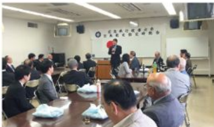
広島県行政書士会広島北支部総会（5月15日）