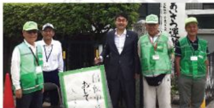
原学区町民運動会実行委員の皆さんと（5月15日）