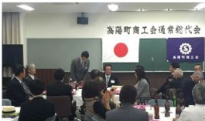
高陽町商工会総代会（5月19日）