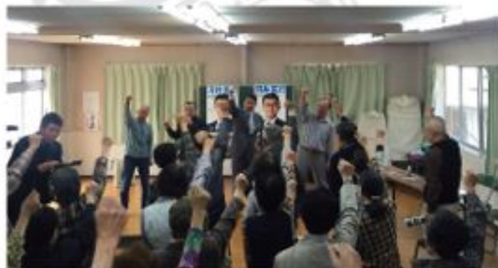
安地域安西支部ふじが丘地区国政報告会（5月8日）