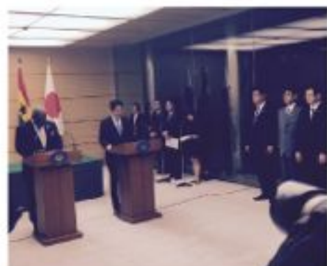
翌連日したマハマ大統領と安倍総理大臣との首脳会談・共同発表に同席した河井克行総理大臣補佐官