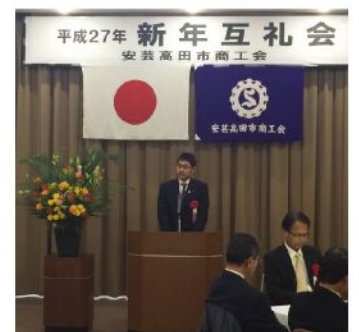
安芸高田市商工会互礼会(1月9日)