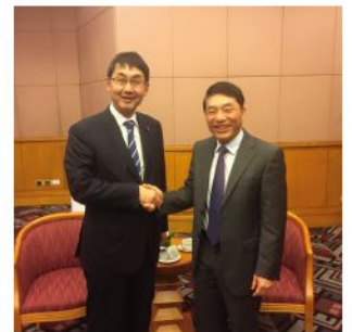
ズン首相の懐刀・タン公安副大臣