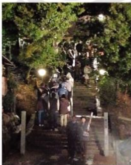
元旦零時の初詣は被災地八木の光廣神社に