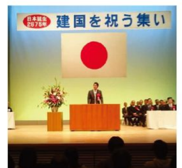
建国を祝う集い(2月11日)