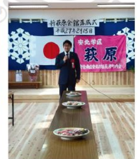
新・萩原会館落成式(2月15日)