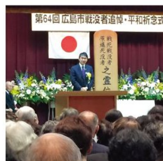
広島市戦没者追悼・平和祈念式(2月8日)