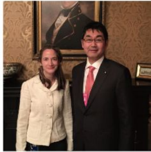
オバマ大統領の個人的信頼が極めて厚いヘインズ大統領補佐官が日本の関係者に会うのは初めて