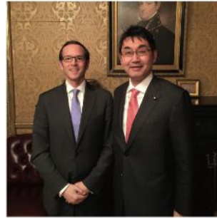
メデイロス・NSCアジア上級部長とはこの二年余りの間に7回目の会談