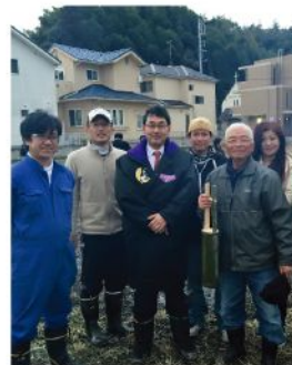
小野地とんど(1月11日)