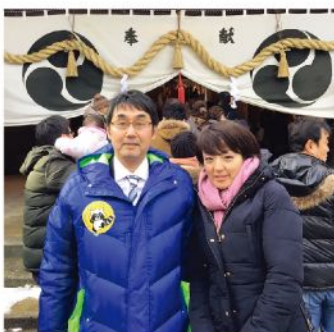
両延神社に初詣(1月1日)