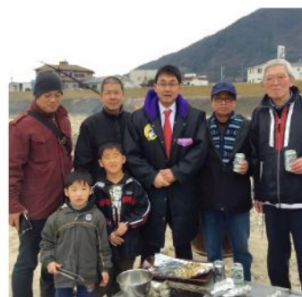
可部二丁目とんど(1月11日)