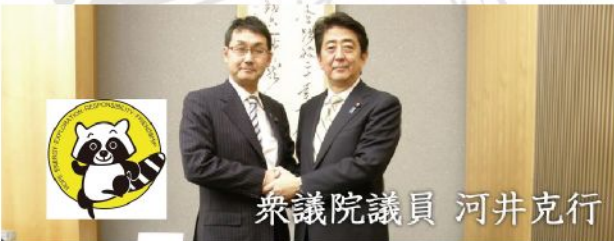
衆議院議員 河井克行