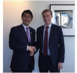
バイデン副大統領安全保障担当首席補佐官を昨秋まで務め、現在ヒラリー・クリントン前國務長官の政治担当顧問ジェイク・サリバン氏と東京で再会(1月8日)