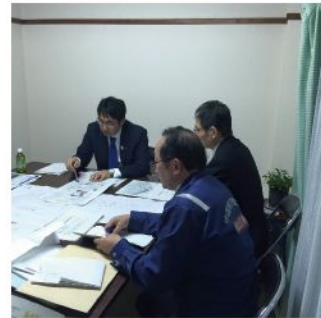
国土交通省中国地方整備局太田川河川事務所、広島豪雨土砂災害対策現地推進室と毎月の意見交換を行う河井克行代議士。(2月13日)

2月3日、平成26年度政府補正予算が成立しました。「8.20.広島豪雨災害」復旧・復興事業費として90億4700万円を確保。①「広島西部山系直轄砂防災害関連緊急事業」が24溪流（八木、緑井、山本、可部東）で57億4200万円。②「広島西部山系直轄砂防事業」が5溪流（八木、緑井、可部東）で13億6000万円。③広島県に支出する交付金対象事業が11ヶ所で19億4500万円。事業箇所の所在地は河井克行代議士公式ホームページ「8.20.広島市北部集中豪雨災害」特設サイトに地図を掲載していますのでご覧ください。一日も早い復旧・復興を実現するため、河井克行代議士は平成27年度政府予算案でもさらなる事業費の確保に努めます。