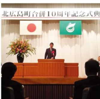
北広島町合併10周年記念式典(2月1日)