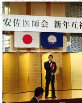
安佐医師会新年互礼会(1月10日)