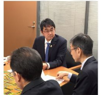
地元からの要望は逐一、国土交通省砂防部や農林水産省林野庁国有林野部に伝えます(2月18日)