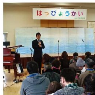
三入東幼稚園発表会(2月8日)