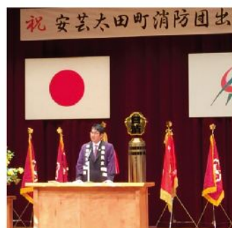
安芸太田町消防団出初式(1月4日)