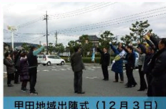
甲田地域出陣式 (12月3日)