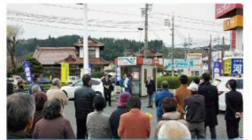
千代田地域出陣式 (12月3日)