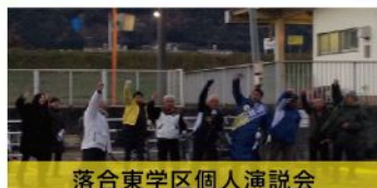
落合東学区個人演説会 （12月13日）