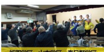
祇園学区・山本学区・春日野学区 個人演説会（12月13日）