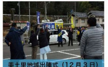
美土里地域出陣式 (12月3日)