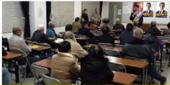
真亀学区個人演説会（12月6日）