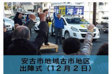
安古市地域古市地区 出陣式（12月2日）