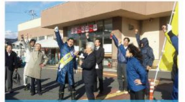
大朝地域出陣式 (12月2日)