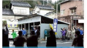
加計地域出陣式 (12月2日)