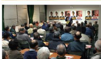
戸山学区個人演説会 (12月5日)