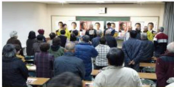
安東学区個人演説会（12月7日）