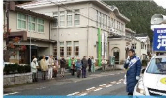
筒賀地域出陣式 (12月2日)