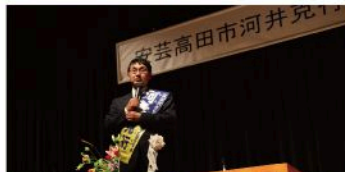
安芸高田市決起大会（12月10日）