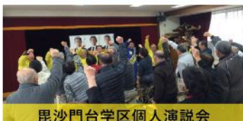
毘沙門台学区個人演説会 （12月13日）