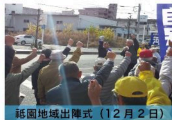
祇園地域出陣式（12月2日）