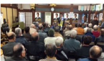
安北学区個人演説会 (12月3日)