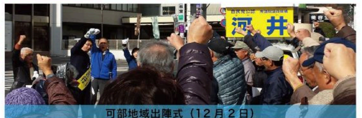
可部地域出陣式（12月2日）