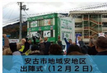
安古市地域安地区 出陣式（12月2日）