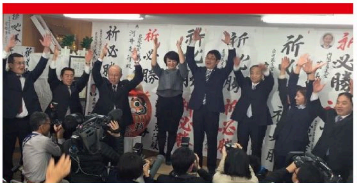
決意を新たに、これからも走りつづけます！ （12月14日）