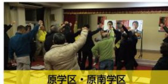
原学区・原南学区 個人演説会（12月9日）