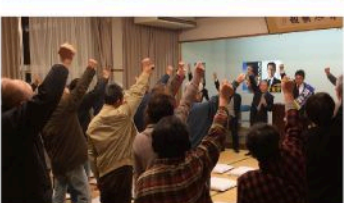
狩小川学区個人演説会 (12月4日)