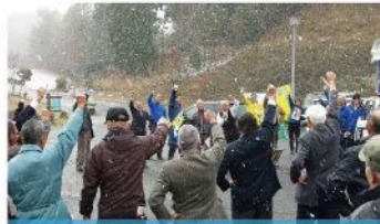
豊平地域出陣式 (12月2日)