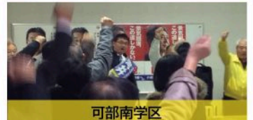
可部南学区 個人演説会（12月8日）