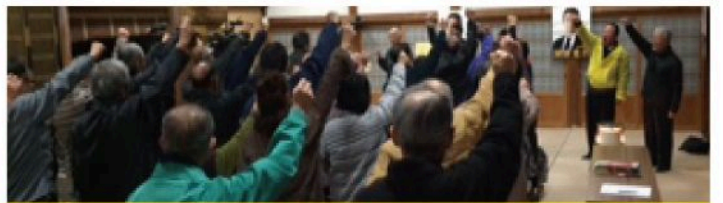
梅林学区個人演説会 (12月3日)