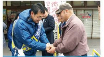
高宮地域出陣式 (12月3日)