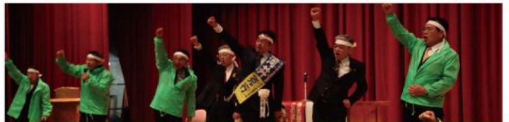
安芸太田町決起大会（12月10日）