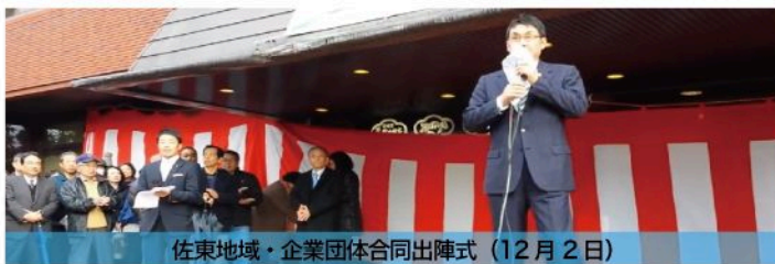
佐東地域・企業団体合同出陣式（12月2日）