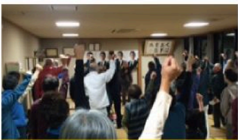
八木学区個人演説会 (12月3日)