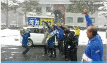
芸北地域出陣式 (12月2日)