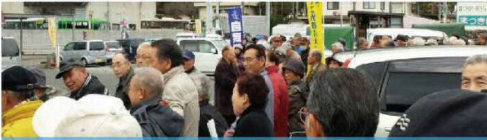
安佐町出陣式 (12月2日)