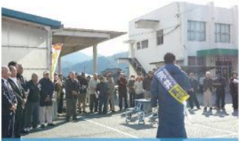
向原地域出陣式 (12月3日)