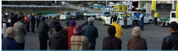
白木町出陣式 (12月3日)