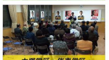
大塚学区・伴南学区 個人演説会 (12月5日)