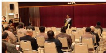
北広島町決起大会（12月10日）