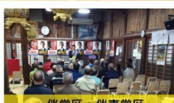
伴学区・伴東学区 個人演説会 (12月5日)