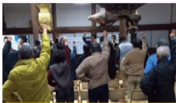
安学区個人演説会 (12月3日)