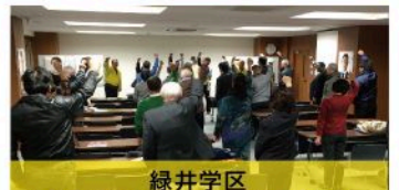
緑井学区 個人演説会（12月11日）