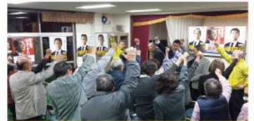
上安学区個人演説会（12月7日）