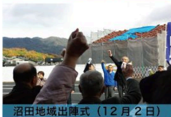
沼田地域出陣式（12月2日）