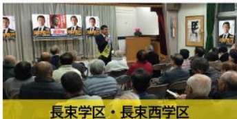
長束学区・長束西学区 個人演説会（12月9日）