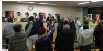
可部学区個人演説会（12月8日）