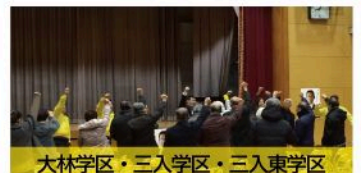
大林学区・三入学区・三入東学区 個人演説会（12月12日）