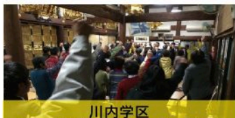
川内学区 個人演説会（12月11日）