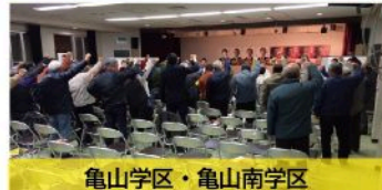
亀山学区・亀山南学区 個人演説会（12月8日）