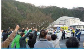
戸河内地域出陣式 (12月2日)