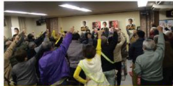
倉掛学区個人演説会（12月6日）