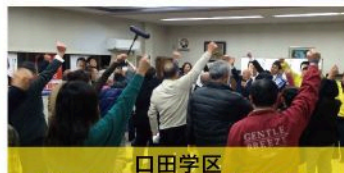
口田学区 個人演説会（12月11日）