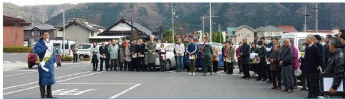
吉田地域出陣式 (12月3日)