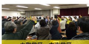
大町学区・古市学区 個人演説会（12月13日）