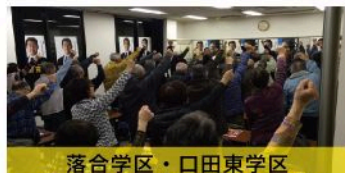
落合学区・口田東学区 個人演説会（12月11日）