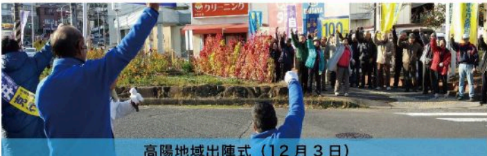
高陽地域出陣式 (12月3日)