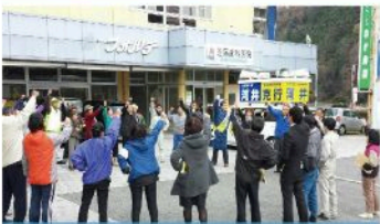
八千代地域出陣式 (12月3日)