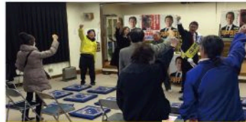
亀崎学区個人演説会（12月6日）