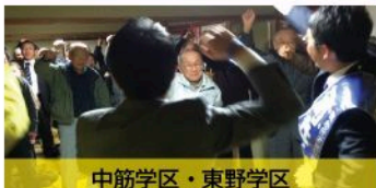
中筋学区・東野学区 個人演説会（12月9日）