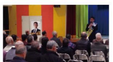
白木町決起大会 (12月4日)