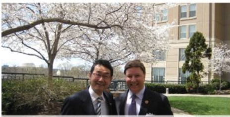
ロジャース下院軍事委員会戦略・戦力小委員長 (共)