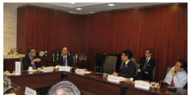
戦略国際問題研究所（CSIS）で知日派有識者と朝 食会