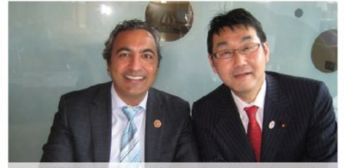
ペラ外交委員会アジア・太平洋小委員会筆頭委員代理 (民)