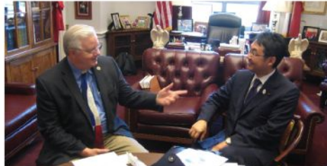
バートン下院前エネルギー・商業委員長 (共)