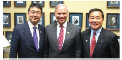
フォーブス下院軍事委員会海軍力小委員長 (共)