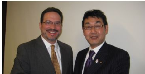
グリーン元NSCアジア上級部長 (CSIS)