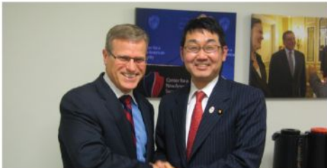
クローニンCNA S上級顧問