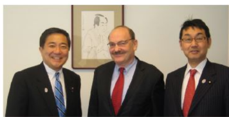
カルダー高等国際問題研究大学院 (SAIS) ライシャワー東アジア研究所長