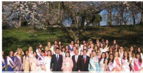
日本大使公邸で華やかに開かれた桜レセプション