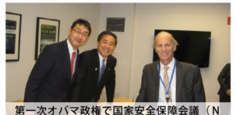
第一次オバマ政権で国家安全保障会議 (NSC) 上級東アジア部長を務めたベイダー・ブルッキングス研究所上級研究員