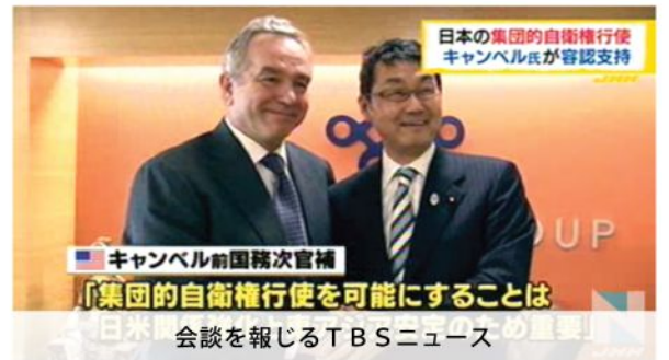
日本の集団的自衛権行使 キャンベルが容認支持 「集団的自衛権行使を可能にすることは 日米同盟の重要な要素」 会談を報じるTBSニュース