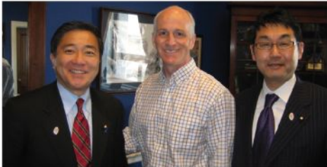
スミス下院軍事委員会筆頭委員 (民)