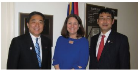
ディゲット下院日本研究グループ共同議長 (民)