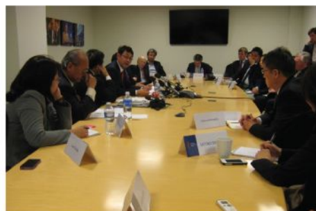
新アメリカ安全保障センター（CNAS） で講演