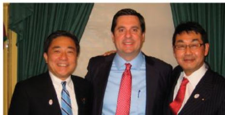
ニューネス下院ジャパン・コーカス共同議長 (共)